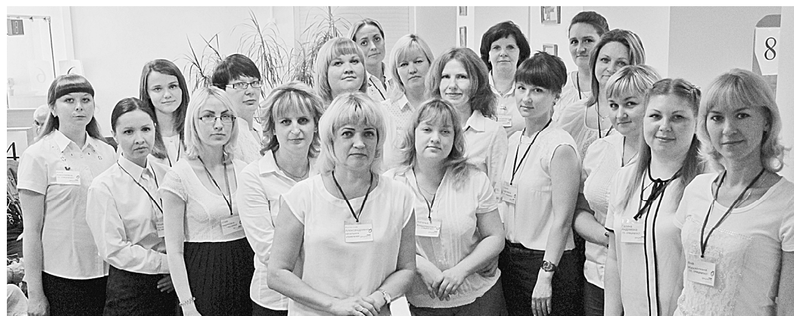
Коллектив МФЦ всегда придет вам на помощь

— Безусловно, систему «единого окна» оценили многие боровичане. Если в 2012 году среднемесячное количество обращений к нам составляло 320 человек, то к концу 2015 года эта цифра выросла до 7000. Нагрузка на универсальных специалистов очень большая. Иногда ожидание в очереди состав-